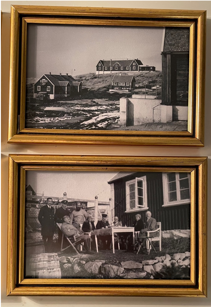
Billeder fra 1920erne

Patienthotellet var dengang hele hospitalet og bygningen er næsten uændret