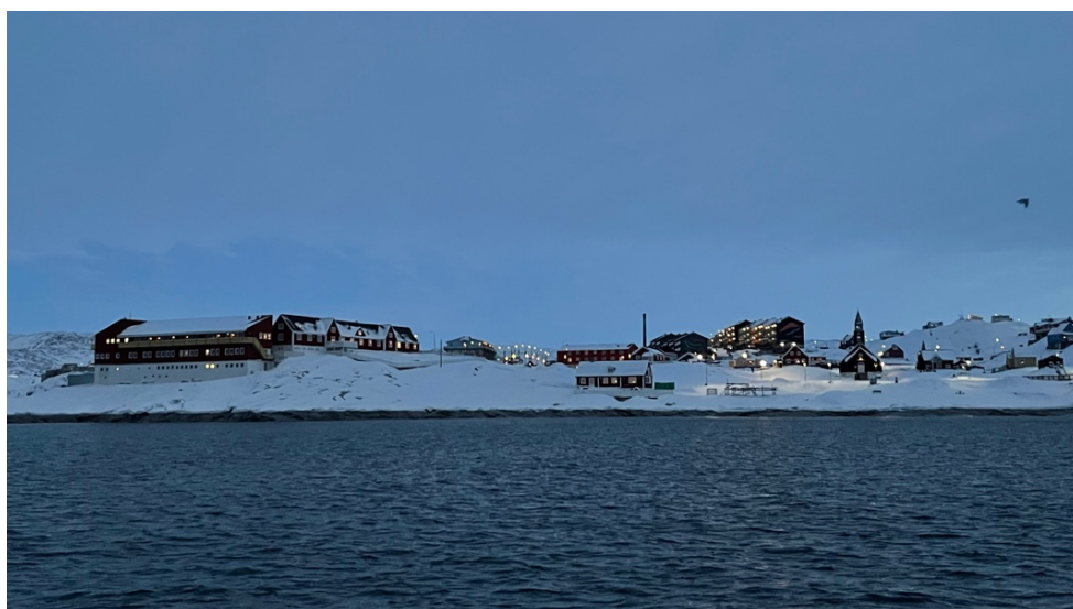
Kirkebugten og hospitalet