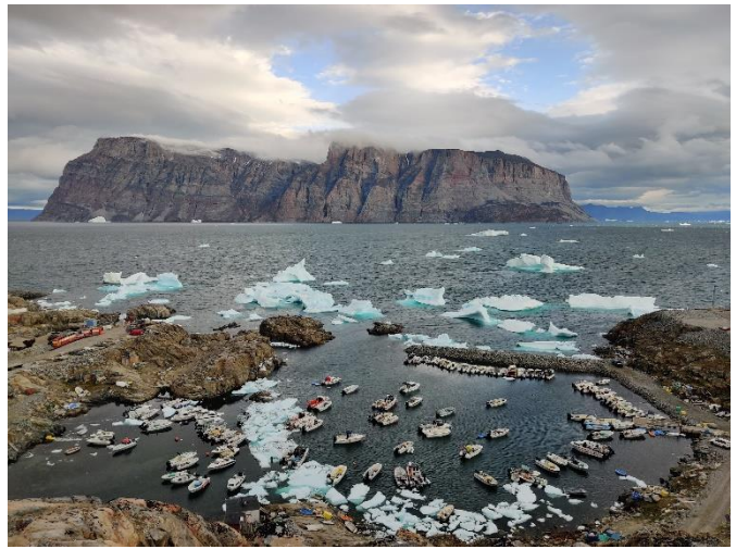
Storøen som man kan se fra Uummannaq.