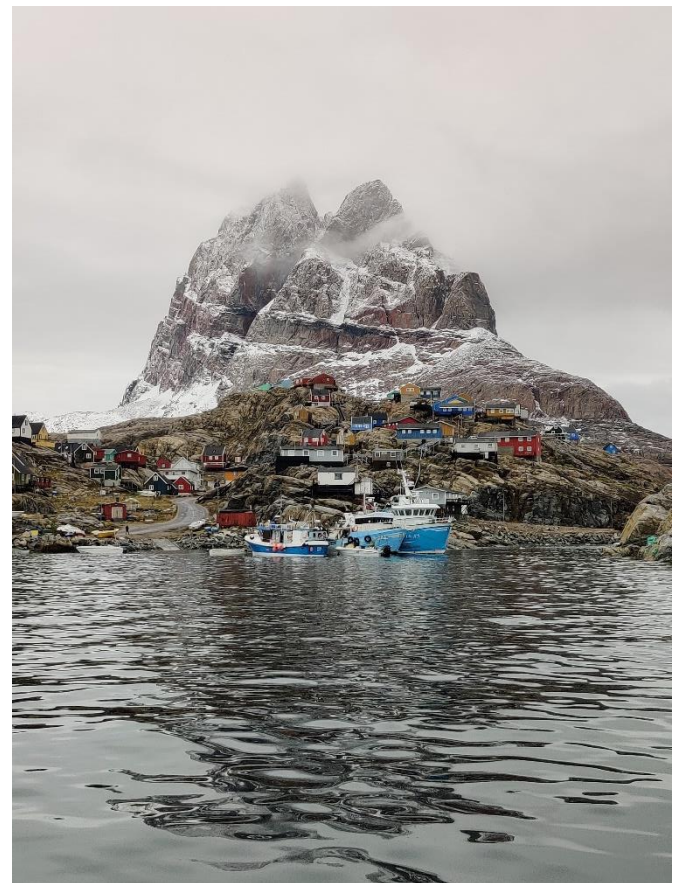
Uummannaq og hjertefjeldet set fra båden på vej hjem fra bygdetur (den sidste uge jeg var der, kom sneen).