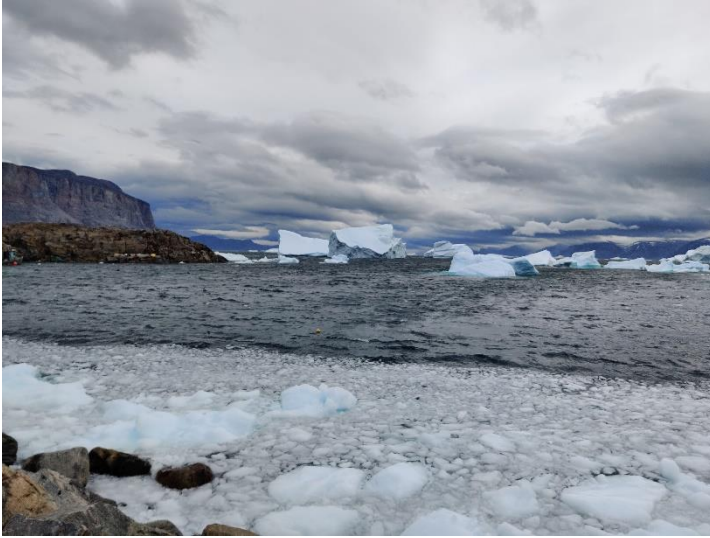
Udsigten ændrede sig hver dag.