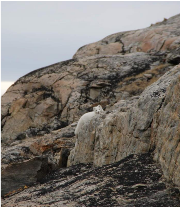
En lille polarræv fra en af vandreturene.