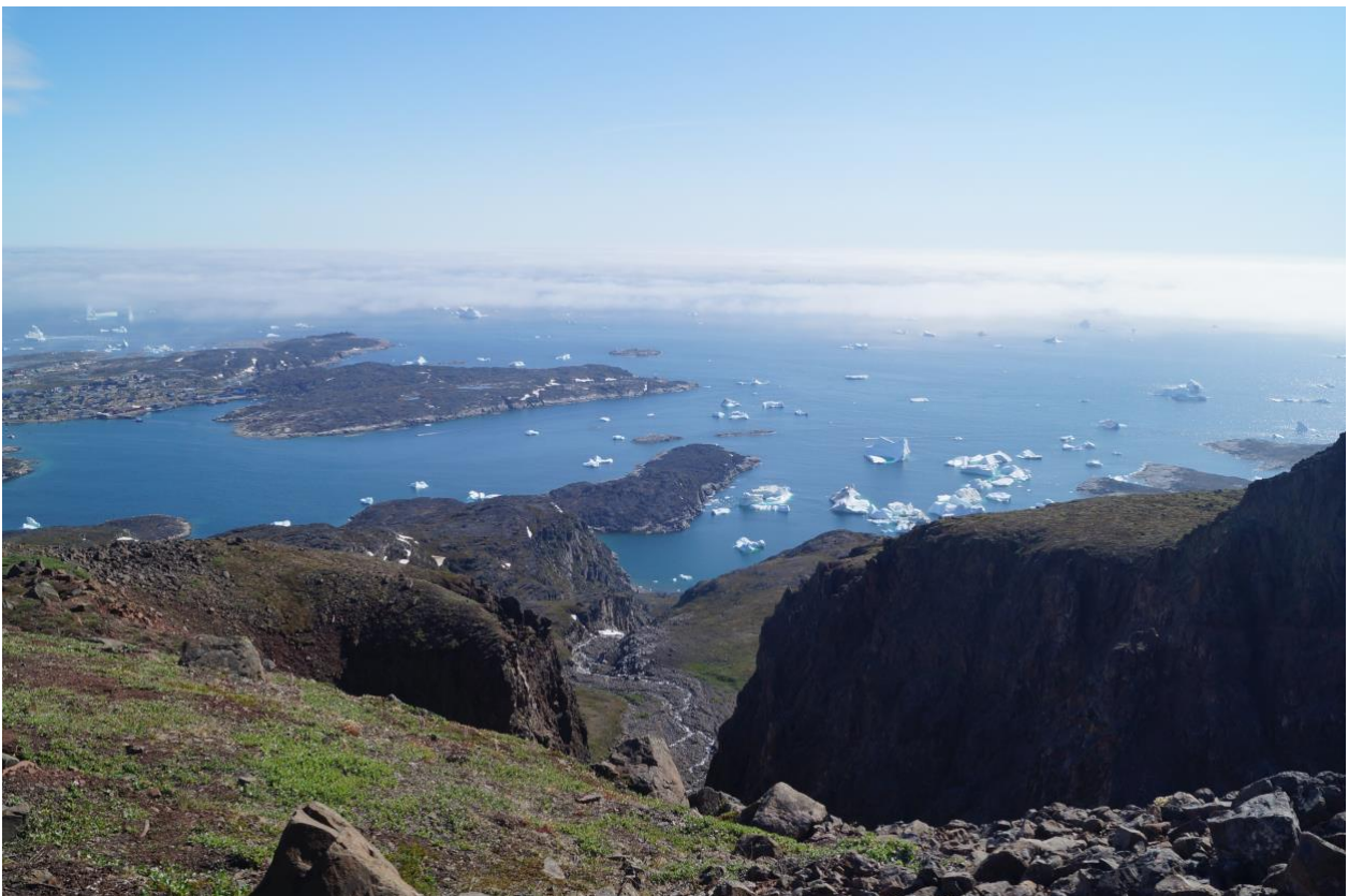
Udsigt fra Isbrægen, Diskøen