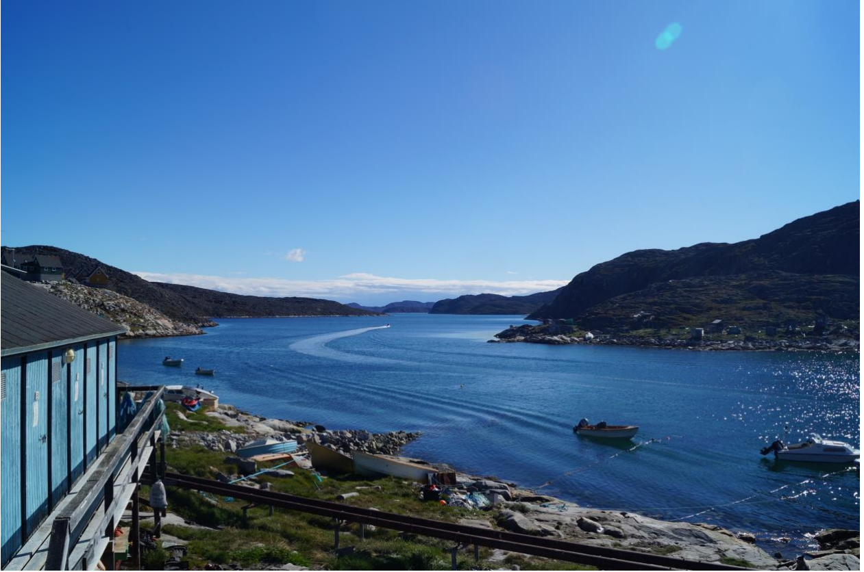
Udsigt fra sydsiden af Asiaat